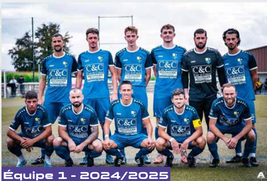
Équipe 1 - 2024/2025