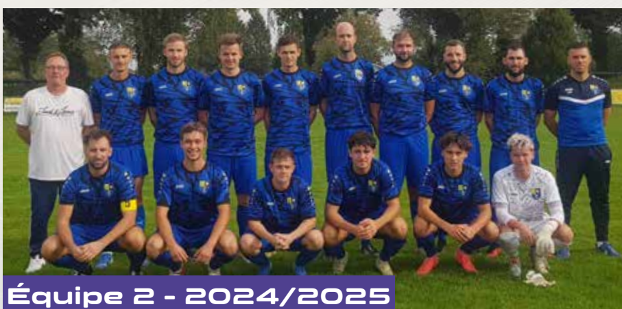
Équipe 2 - 2024/2025