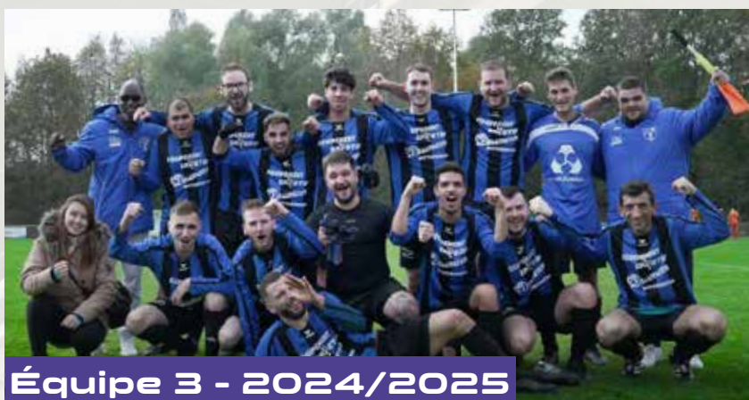
Équipe 3 - 2024/2025

Que cette saison, que nous espérons complète, apporte beaucoup de joie à tous, partenaires, supporters, joueurs, joueuses, arbitres, dirigeants et bénévoles, et sachez que nous serons toujours à votre écoute afin que l'histoire de l'UNION SPORTIVE DE WITTERSHEIM continue de s'écrire dans les meilleures conditions.